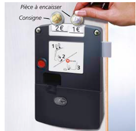
Serrure à encaissement twin-coin multi-usage