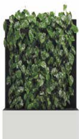
□ RAL 9016 blanc signalisation Protection RAL 7021 gris noir

Merci d'indiquer votre combinaison de couleur lors de la commande