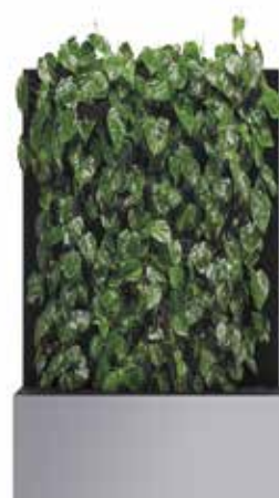
■ RAL 9006 aluminium blanc Protection RAL 7021 gris noir